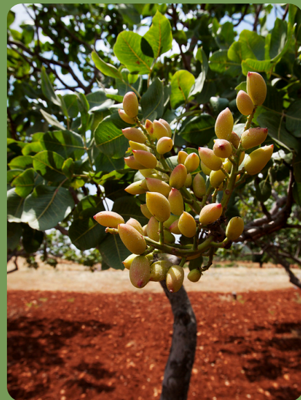
【ピスタチオメーカーの臨床データ計画中】